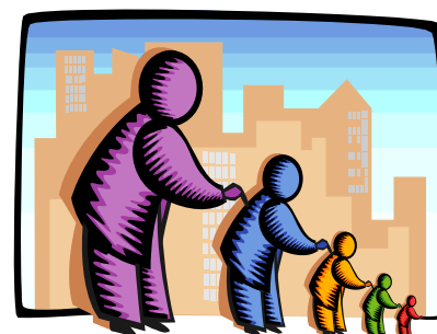
L'Écho transmet l'information