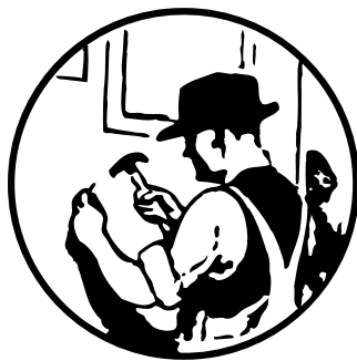
La rénovation de plus en plus populaire