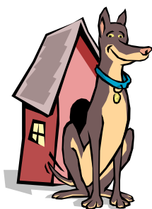
Quel numéro identifiera-t-il votre chien?