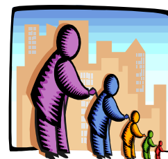
L'Écho transmet l'information