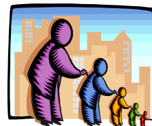
L'Écho transmet l'informa-