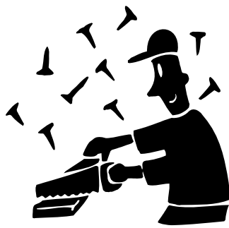
La rénovation de plus en plus populaire