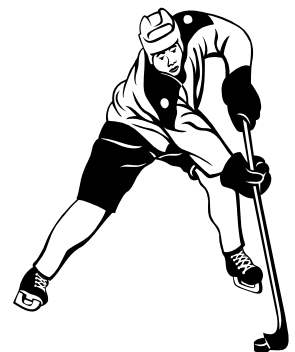
Les jeunes en action...

Le Comité loisirs et social Saint-Luc-de-Vincennes.