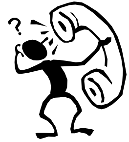
Des informations intéressantes....

Stanislas. Réservation d'une table 20 $ avant le 18 avril à Martine Gauthier (418) 328-3877. Un minimum de 15 tables est requis pour tenir l'activité.