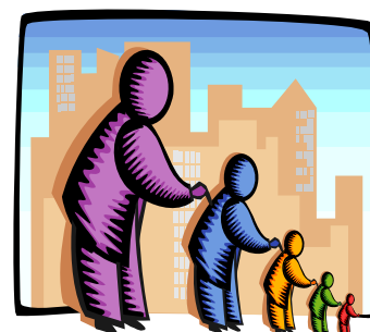
L'Écho transmet l'information

Le 5 juillet à 20 h, la population est invitée à venir rencontrer à la salle municipale les représentants de SER, la compagnie qui a eu le contrat pour enlever le tas de compost. Ces derniers expliqueront leur façon de procéder afin de ne pas nuire à la population. Cela représente environ 4 années d'opération. Pour le moment il n'y a aucune opération de transport, quand le moment sera venu vous serez informés.