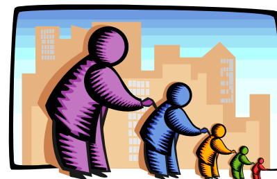
L'Écho transmet l'information