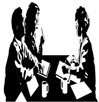
Un nouveau comité en matière de loisir