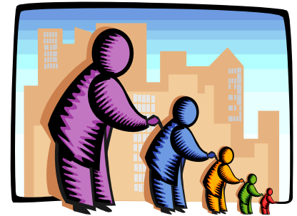
L'Écho transmet l'information