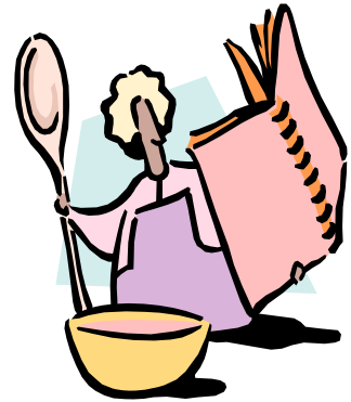
Rien de tel qu'un bon repas maison